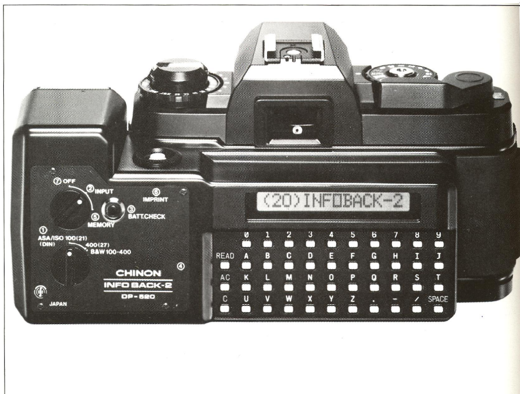
Kameraet koster kroner 3.975,00 i vejledende udsalgspris.

Det var ikke uden stolthed, at A-S Finn Jensen, der markedsfører CHINON i Danmark, lancerede verdens første to-programs spejlrefleks-kamera CP-5. Det kom umiddelbart efter verdenspremieren her til landet med en hale af fototekniske lovord efter sig — blandt andet fra en række eksperter på Photo-Kinamessen i Köln. Men CHINONs teknikere havde også præsteret noget ganske enestående ved at indbygge et imponerende, dobbeltvirkende lysmålings computerprogram i kamerahuset. Programmet præsterer lynhurtigt en lysmåling af det ønskede motiv. Derpå dykker det ned i computerens forprogrammerede lager af lysmålinger og vælger i brøkdelen af sekunder det korrekte eksponeringsforhold og indstiller kameraets lukker og blænder derefter. Resultatet er derfor perfekt belyste billeder. Til de motiver, som er vanskelige at måle helt korrekt med selv et så avanceret lysmålings-system, byder CP-6'eren på en virkelig professionel metode. Det er den såkaldte spot/average — gennemsnits — lysmåling. Ved denne spotlysmåling, hvor man faktisk måler lyset på omkring 2% af motivfladen, bearbejder computeren oplysningen og